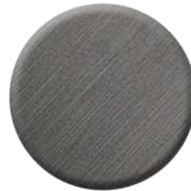
C51 Brushed Metal Black