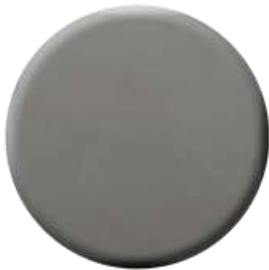
C50 Metal Black