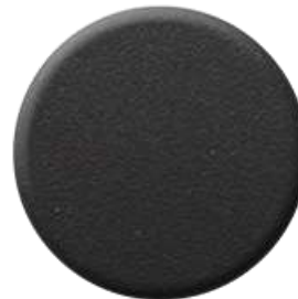
N1 Nero Opaco Goffrato Embossed Matt Black