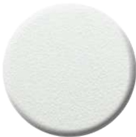
W1 Bianco Opaco Goffrato Embossed Matt White