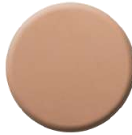
P70 PVD Rose Gold