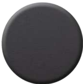
N7 Nero Soft Touch Black Soft Touch