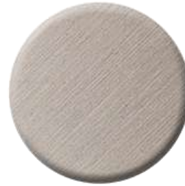
C3 Brushed Nickel