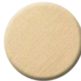
C41 Brushed Gold